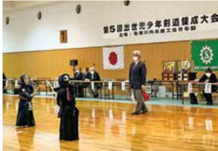
【情報提供：薩摩川内市商工会青年部】

平成16年まで旧入来町で開催していたものを、薩摩川内市商工会青年部の呼び掛けにより平成28年に再開したものです。コロナ禍で3年ぶりの開催となり、市内の小学生62人が白熱の試合を繰り広げました。