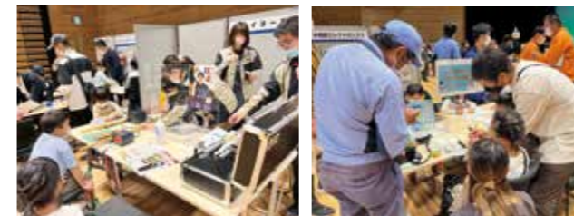
【情報提供：事業協同組合薩摩川内市企業連携協議会】

市内の企業16社と学校2校が参加し、各ブースでは、子どもたちが企業のお仕事の話を聞いたり、ものづくりを体験したりして、企業へ関心を深めました。