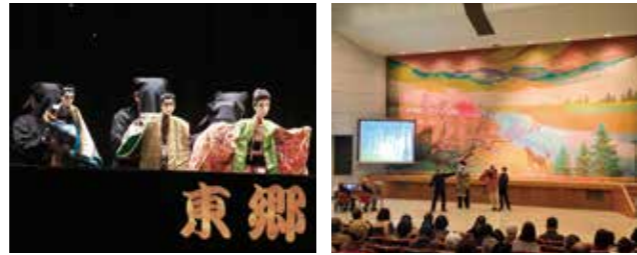
【情報提供：東郷文弥節人形浄瑠璃保存会】

源氏烏帽子折二段自「常盤御前雪の段」を披露し、伝統の継承につながるよう地元の高校生も一緒に公演に参加しました。