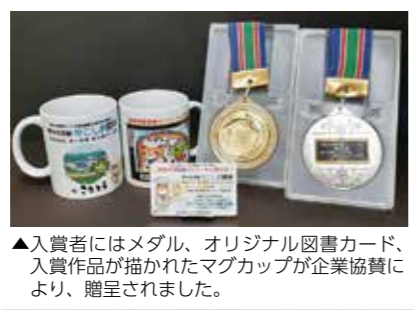
▲入賞者にはメダル、オリジナル図書カード、入賞作品が描かれたマグカップが企業協賛により、贈呈されました。

実行委員会ホームページは、この他にもさまざまな活動の様子を紹介しています。ぜひご覧ください。 ▲ホームページ ▲Instagram