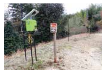
▲侵入を防ぐための電気柵

電気柵を設置することで、電気ショックを与え、痛みにより柵は危険だと学習させることで、柵に近寄らなくなり、侵入を防ぐ効果があります。正しく設置し運用することが、より効果的な被害防止対策になります。