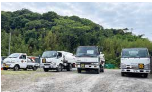
▲重油を配達する車

地域の方が立ち寄られる際、世間話に花が咲くこともあり、地域を身近に感じられます。各家庭や企業に配達するときには「いつもありがとう」の言葉に励まされ、生活に欠かせないものに携わっていることにやりがいを感じます。その他、工事現場には、重機の稼働に必要な重油を配達しますが、その現場が完成してか