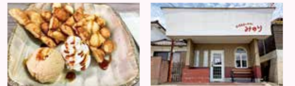
▲鶏蛋仔(エッグワッフル) +ホイップクリーム+黒糖アイス

掲載店募集中!! 秘書広報課までご連絡ください。 【締切】7月28日(金)消印有効