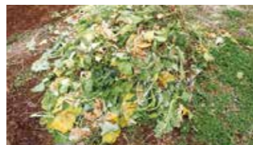
▲【悪い例】放置された野菜

有害鳥獣に餌場を提供しないこと、人間は怖い生き物だとして、さりげなく知らせることが重要です。