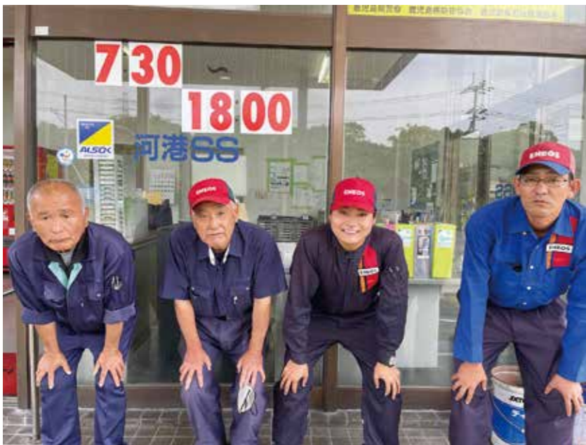
▲南園所長(左から2人目)と社員の方々

車なども行っています。事業を展開する上で、「物」ではなく、「安全」を提供できるように心掛けています。