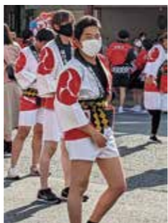
▲グループとして参加した薩摩川内はんやまつり