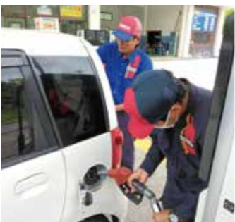
▲ガソリンを給油の様子