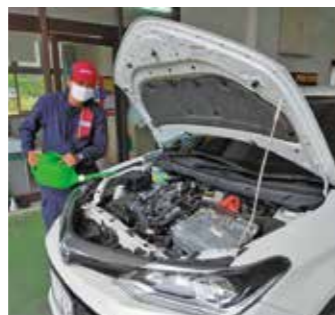
▲ウィンドウォッシャー液を補充の様子