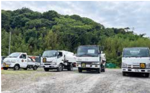
▲重油を配達する車

地域の方が立ち寄られる際、世間話に花が咲くこともあり、地域を身近に感じられます。各家庭や企業に配達するときには「いつもありがとう」の言葉に励まされ、生活に欠かせないものに携わっていることにやりがいを感じます。その他、工事現場には、重機の稼働に必要な重油を配達しますが、その現場が完成してか