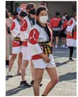
▲グループとして参加した薩摩川内はんやまつり

安心して仕事を任せてもらえるよう、一人一人の声に耳を傾けることを意識するなど、お客さまとのコミュニケーションも大事にし、日々の業務の中でスキルアップを図っていきます。