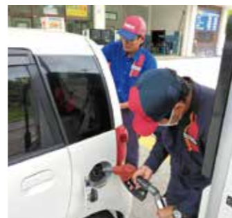
▲ガソリンを給油の様子

車なども行っています。事業を展開する上で、「物」ではなく、「安全」を提供できるように心掛けています。