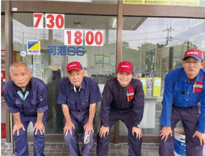
▲南園所長(左から2人目)と社員の方々

南日石油株式会社は、昭和42年に開業し、プとして昭和42年に開業し、上川内、河港、田海の3店の給油所があります。ガソリン、軽油、灯油などの石油製品の販売、配達やエンジンオイル、冷却水、バッテリー液のチェック、タイヤ交換、洗