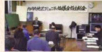
▲設立総会の様子(広報薩摩川内No.14より)

現在では、各地区コミュニティ協議会を核としたまちづくりが活発に展開され、複数の地区コミュニティ協議会が連携してイベントを実施するなど、お互いの魅力を引き出す広域的な活動も行われています。