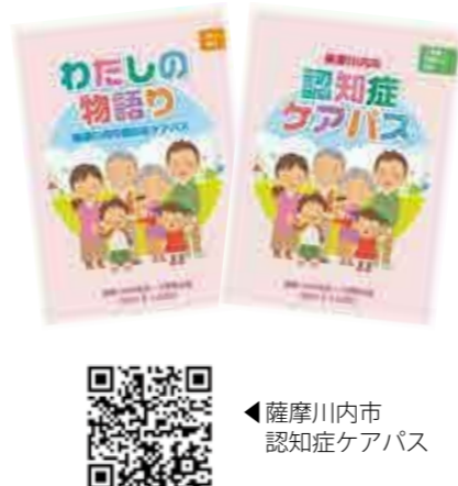
▲薩摩川内市 認知症ケアパス

本市では、認知症の原因や症状、対応などをまとめた、本人向けと家族、地域の方向けの2種類の「認知症ケアパス」を作成しています。左記の二次元コードからダウンロードできます。