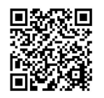
▲すてきびと(生 涯学習人材パ ンク)の募集と 登録者紹介