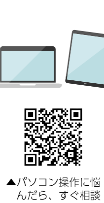
▲パソコン操作に悩 んだら、すぐ相談

市では、家庭教育、青少年教育、 成人教育など、さまざまな事業を実 施しています。今回は、市民の皆さ んが気軽に参加できる事業を紹介し ます。