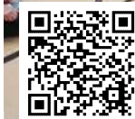
▲子育てサロン において