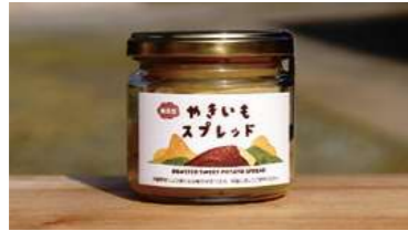
【情報提供：峰山地区コミュニティ協議会・やなぎやま村】

これは柳山のサツマイモを活用し、焼き芋の甘みをそのまま生かして無添加で仕上げた一品で、柳山の魅力がたっぷり詰まっています。