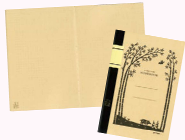
▲竹紙100ノート(中越パルプ工業㈱川内工場提供)