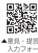
▲意見・提言入力フォーム

を持続発展させるために、本市の小・中・義務教育学校における教職員の働き方改革を推進するための計画を策定するもの 所 市庁、本庁1階情報公開コーナー、本庁5階学校教育課、各支所、甌島振興局、各市民サービスセンター、中央公民館、各地域公民館、中央図書館、鹿児島純心大学、川内職業能力開発短期大学校、川内看護専門学校 希望者には資料送付 期 5月25日(月)～6月24日(水) 消印有効 方 意見・提言入力フォームまたは任意の様式に住所、氏名、意見・提言を明記の上、直接、送付、ファクス、メール 問 本庁学校教育課人事管理G ☎(5341) ☎(21)1285 ✉ jinjikanr@city.satsumasendai.lg.jp