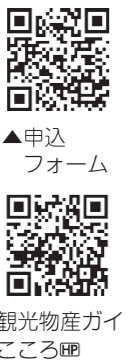
▲申込フォーム ▲観光物産ガイド ところ

内 本市の紹介や観光PR、公的機関などが主催する行事などへの出席 定 2人 ※任期は原則2年間 期 6月30日(火)必着 方 審査日は7月を予定 方 申込フォームまたは、(株)薩摩川内観光物産協会に備え付けの応募用紙に必要事項を明記の上、直接、送付 資 満18歳以上で本市に居住、在学、勤務する方および県内在住の本市出身者 ※性別、年齢、既婚未婚不問 問 〒895・0024 鳥追町1番1号 (株)薩摩川内市観光物産協会 電 (23) 9889