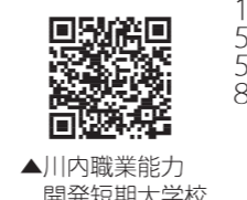
川内職業能力開発短期大学校