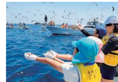
【情報提供：鹿児島地区コミュニティ協議会】

5月30日(土)、鹿児島町蘭牟田で、地元の子どもたちが、ウミネコの餌付け体験を行いました。 海鳥の研究をしている千葉県立中央博物館(千葉市)研究員の平田氏から、ウミネコが絶滅危惧種に指定されていることなどのお話の後、船上で餌付け体験を行いました。約40人の参加者は多くのウミネコが飛び交う様子に歓声を上げ、自然の大切さを学びました。