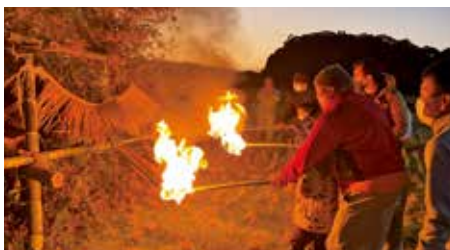
【情報提供：南瀬地区コミュニティ協議会】

同育成会長を中心に作られた孟宗竹のやぐらに、各家庭のしめ縄や門松などを持ち寄り、辰年の子どもたちが火入れを行いました。最後に鬼火で焼いた餅を食べて、大人も子どもも無病息災を願いました。