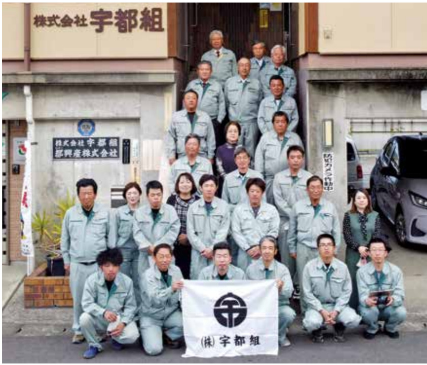
▲宇都代表取締役（前列1列目の左から3番目）と社員の皆さん

中心とした宇都林業として創業した当社は、その後お客さまからのニーズに対応するため建築関係の許可を取得し、土木・建築・不動産業など総合建設業として事業を行ってきました。2020年時点、