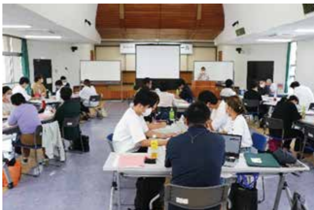
▲令和4年度の創業スクールの様子

年から3年連続で全国創業スクール10選にも選ばれました。 ― 創業する場合の補助は？ ― 市では、創業を後押しするために創業に係る費用の一部を支援する制度が設けられています。 市の補助制度は、近年、社会的な機運やニーズの高まっているSDGs(持続可能な開発目標)に取り組む企業への重点支援も含めた充実した制度で、川内商工会議所では、補助金の申請支援も行っています。