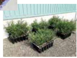
▲植え付け前の苗木