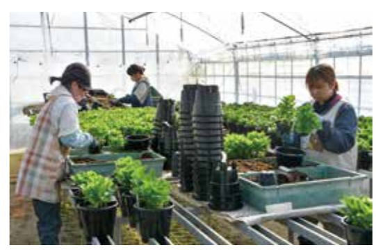
▲農作業（花農家での鉢植え）の様子

働いてみるには? この制度を利用して農作業をするにはどうすればいいんだろう。 市担当者に尋ねたところ、本市に住む方であれば、農業経験は問わず、利用できるみたい。 また、申請時に働ける場所、期間、時間なども確認するの、年齢や経験の有無を問わず、自分の希望する条件で農作業ができるんだとか。