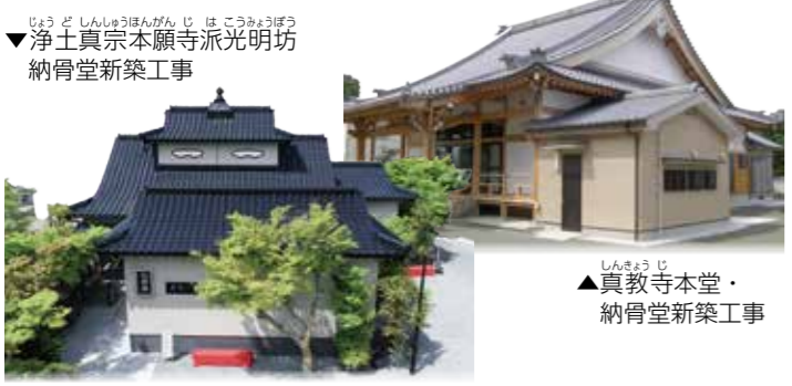
▼浄土真宗本願寺派光明坊 納骨堂新築工事