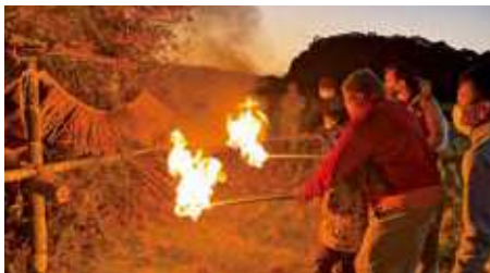
【情報提供：南瀬地区コミュニティ協議会】

同育成会長を中心に作られた孟宗竹のやぐらに、各家庭のしめ縄や門松などを持ち寄り、辰年の子どもたちが火入れを行いました。最後に鬼火で焼いた餅を食べて、大人も子どもも無病息災を願いました。