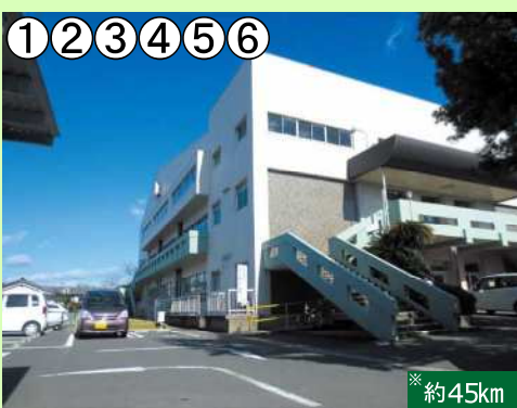
加治木福祉センター