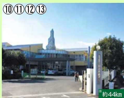
加治木特別支援学校