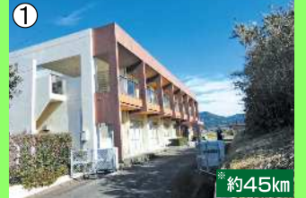
金峰老人福祉センター