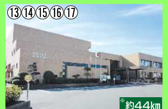
金峰文化センター