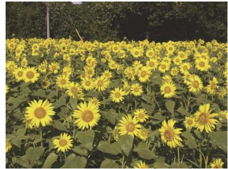
東郷町藤川のひまわり