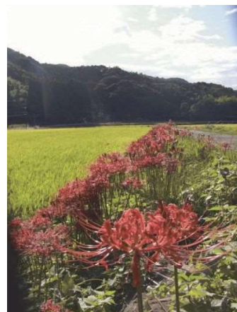
入来・長野地区彼岸花通り

なお、里親には、花壇に名称を付けていただくほか、道路の区間について「〇〇ロード」などの愛称を付けていただきます。