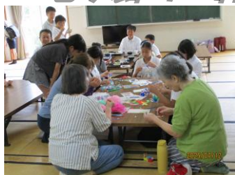
七夕飾りを教わっています

7/12、子ども・地域食堂を開催しました。みんなで楽しく食事をとった後、食材提供していただいた方へのお礼状を作成するとともに、七夕飾りも作成していただきました。