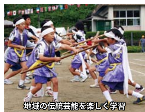
地域の伝統芸能を楽しく学習