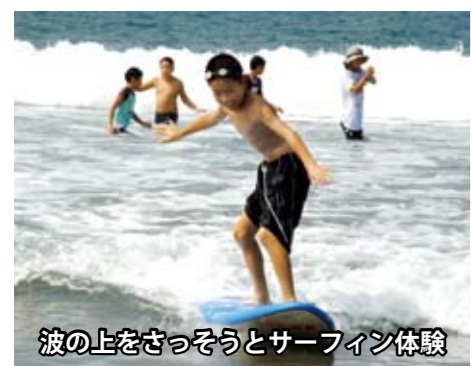
波の上をさっそうとサーフィン体験