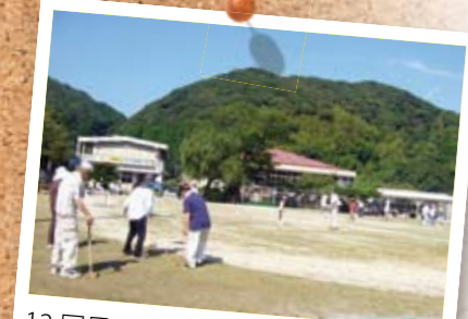
12回目のグラウンドゴルフ大会。はしゃぐ声がこだまします。