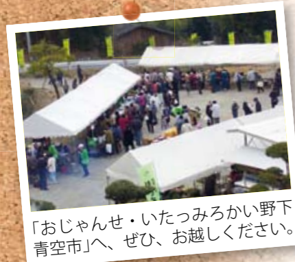
「おじやんせ・いたつみろかい野下青空市」へ、ぜひ、お越しください。

た。本年度12回目です。未就学児も参加していますが、大人たちが教えながらプレイする姿はかわいくてほほ笑ましいです。地区を流れる五反田川は串木野港へと続いていきます。「五反田川をもっときれいに」を合言葉に、平成14年度から野下小学校と連携し、廃油せっけん作り、川の浄化を目的として炭を川に入れるなどの環境保全活動を行っています。この炭は、窯作りに始まり、自分たちの手作りです。その成果として「ホテルを見る夕べ」も行っています。野下地区の一大イベントとして、「おじやんせ・いたつみろかい野下青空市」があります。新鮮な野菜や果物のほか、飲食コーナーもあります。本年度は、平成21年2月22日(日)に開催予定です。皆さんのお越しを地区民みなでお待ちしております。