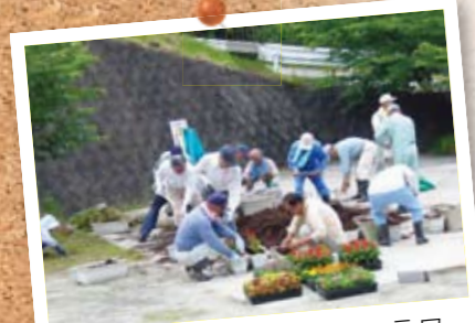
年2回、地区内の花壇やフラワーポットの花苗を植え替えます。