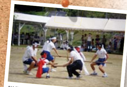
鎌踊りは、かま、三尺刀、六尺棒を持ち、前後6人1組で踊ります。