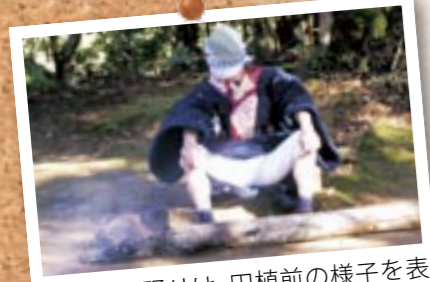
次郎次郎踊りは、田植前の様子を表現した無言の即興劇で、毎年3月に奉納されています(草道芸能保存会)。