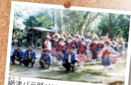
網津バラ踊りは、今も水引小・中学生へと受け継がれ披露されています(網津保存会)。