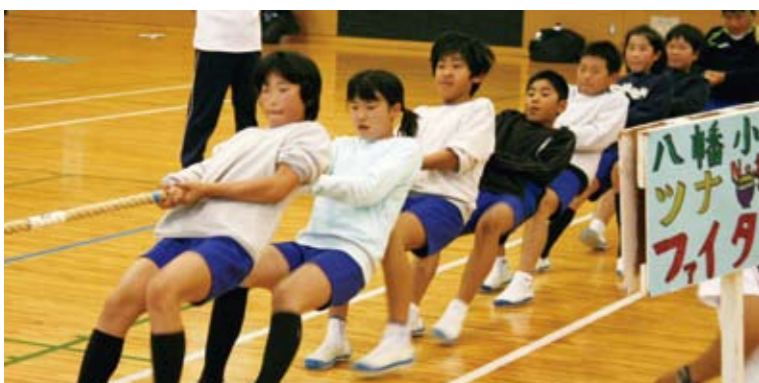
みんな真剣! 負けないぞ。

6月12日(金)、「花の日」(6月第2週)にちなみ、のぞみ幼稚園児ら17人が岩切市長に花束などを贈呈。これは園児らが持ち寄った花々を束ねたもので、お世話になっている方々への感謝と、成長を見守ってほしいとの思いから贈られたものです。