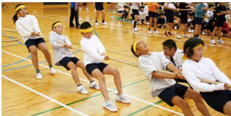
さあ、もう少しだ! ガンバレ~!