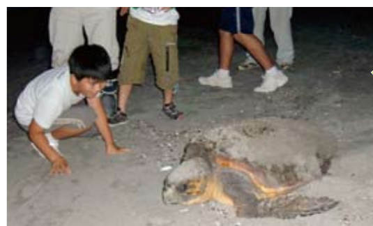
川内 元気な子ガメが 生まれますように

6月13日(土)、みなと公園で、「第55回遠目木ゲートボール大会」が開催されました。小学生から高齢者まで計8チームが参加。なかなかゲートを通すことができず苦労したチームもありましたが、世代を超えた交流に最後まで笑顔の絶えない大会となりました。