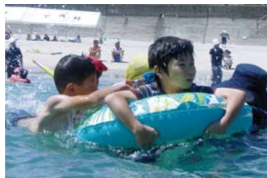
下郷 夏空の下 待ちに待った海開き

6月7日(日)、新田神社御神田で、御田植祭があり、早男と早乙女が五穀豊穡の願いを込め、早苗を一本ずつ丁寧に植えました。また、県指定無形民俗文化財の樋脇町倉野の奴踊りと、宮内町の奴振踊も奉納されました。