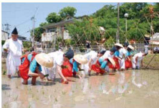
川内 今年の豊作を願い 御田植祭

6月7日(日)、新田神社御神田で、御田植祭があり、早男と早乙女が五穀豊穡の願いを込め、早苗を一本ずつ丁寧に植えました。また、県指定無形民俗文化財の樋脇町倉野の奴踊りと、宮内町の奴振踊も奉納されました。