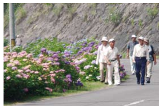
川内 色鮮やかな あじさいロードを堪能

6月12日(金)、野下小学校の児童ら5人が、地域の方々とふれあい活動の中で「野下鎌踊り」を練習しました。保存会と経験者の指導の下、「さあさあさ!」と元気に掛け声を上げ、六尺棒、鎌、三尺刀を軽快に打ち合って踊り、けいこに励んでいました。