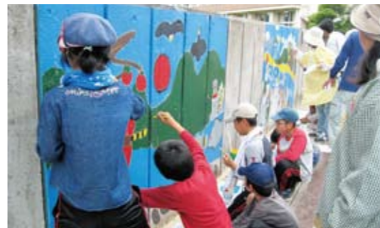
東郷 12年ぶりによみがえった鳥丸の四季 壁画再生

6月20日(土)手打港で、手打地区コミュニティ協議会主催による、市内で一番早い海開きが行われました。安全祈願の神事が行われたあと、待ちに待った子どもたちは、元気よく海に走り出し、一足早い夏を楽しんでいました。