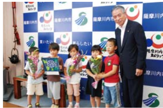
川内 いつも私たちのことを 見守ってくれてありがとう

鳥丸小学校の5・6年生が小学校外壁の壁画再生に取り組みました。鳥丸の美しい四季を描いたこの壁画は、12年前に地区子ども育成会が作成したもの。先輩たちの志を受け継ぐすばらしい鳥丸の伝統がここにも生きています。