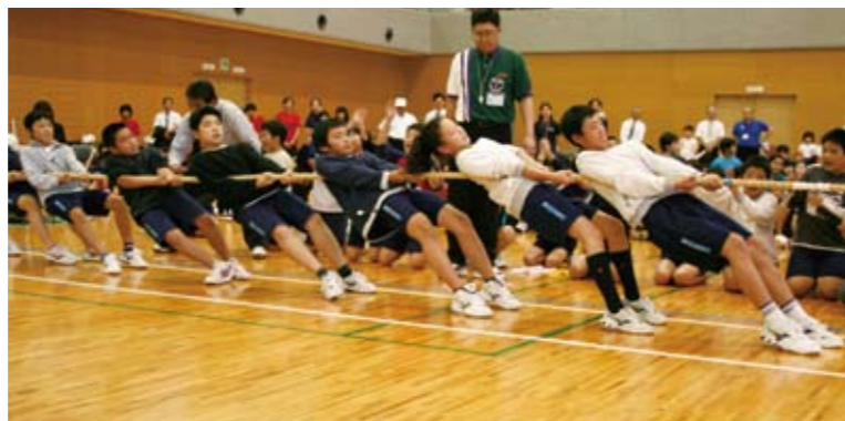
綱を引くフォームがとてもきれいです。