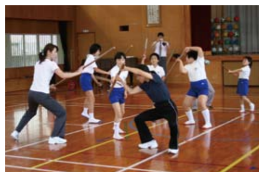
樋脇 伝統芸能を通して交流 野下鎌踊りの継承

5月29日(金)、サンアリーナせんだいで、小学校綱引競技大会が開催されました。市内41校47チームが参加し、男女混合の8人制と10人制に分かれて元気よく綱を引き合いました。