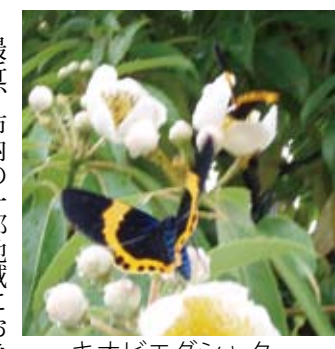
キオビエダシヤク

【縦覧・意見書提出期限】 8月5日(水)まで 【異議申立期間】 8月6日(木)～8月20日(木)15日間 【所】 本庁4階農政課および各支所産業建設課 【問合せ先】 本庁農政課農業振興G(内線4222) イヌマキの害虫防除 最近、市内の一部地域におきまして、イヌマキ(ヒトツバ)を食害し枯死させる害虫「キオビエダシヤク」が異常発生しています。 植栽している場合は、薬剤などで防除してください。薬剤は「トレボン乳剤」(4000倍)や、「スプラサイド乳剤」(1500～2500倍)が効果的です。なお、散布する際は薬剤の飛散がないように十分注意してください。 【問合せ先】 本庁林務水産課林業振興G(内線4261)および各支所産業建設課農業振興G