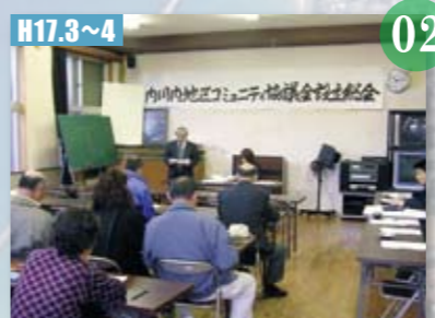
H17.3~4 48地区コミュニティ協議会設立