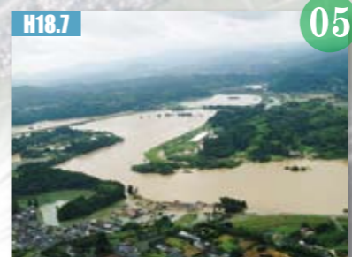
H18.7 県北部豪雨災害が発生