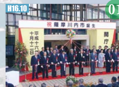
H16.10 薩摩川内市開庁式