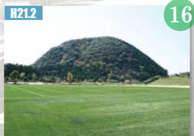
H21.2 樋脇町に丸山自然公園人工芝サッカー場が完成