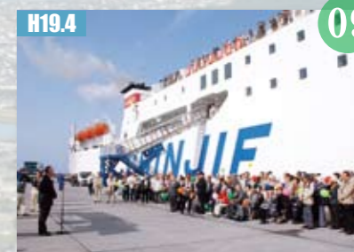
H19.4 「新鑿真」川内港寄港20周年

11月 東部消防署栲笈院分署落成式 蘭牟田池がラムサール条約湿地に登録決定(ベッコウトンボ) 平成18年 1月 ファミリーサポートセンター薩摩川内開設 1Cカード標準システムが稼働(住民対話型のテレビ会議システム、申請書自動作成システムなど) 薩摩川内市総合計画・基本計画決定(平成17年6月16日基本構想議決) 入来町に新設高校設置を決定、平成19年4月開校 蘭牟田瀬戸架橋の事業化が決定 薩摩川内市小中一貫教育特区が認定 課内グループ制導入(本庁企画政策部・支所) 薩摩川内市地域包括支援センター開設 川内大綱引が県の無形民俗文化財に指定 5月 第1回薩摩川内市春の芸能祭開催 6月 第18回知事と語るうかがが甌島(上甌町)で開催 7月 公共交通機関利用促進補助券スタート 補助金等基本条例制定(平成19年度から適用) 9月 県北部豪雨災害発生 鹿児島県北部豪雨が激甚災害指定 県民体育大会川内大会開催 薩摩川内警察署名称変更、管轄見直し 旧栲笈院町区域が管轄区域に 川内川が河川激甚対策特別緊急事業「激特」に指定 コミュニティバス運行開始