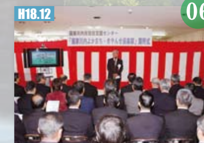
H18.12 薩摩川内よかまち・きやんせ俱樂部を設置