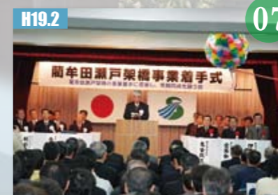
H19.2 蘭牟田瀬戸架橋事業着手式