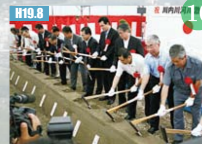
H19.8 河川激甚災害対策特別緊急事業着工式