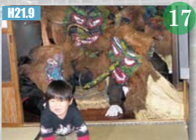
H21.9 甌島のトシドンが、ユネスコ無形文化遺産に登録