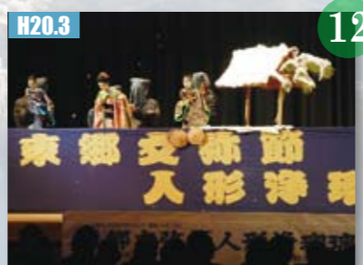
H20.3 東郷文弥節人形浄瑠璃が、国の重要無形民俗文化財に指定