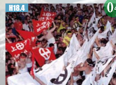
H18.4 川内大綱引が県の無形民俗文化財に指定