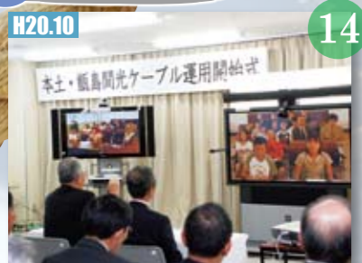
H20.10 本庁と甌島地域の4支所を結ぶ、海底光ケーブル回線完成