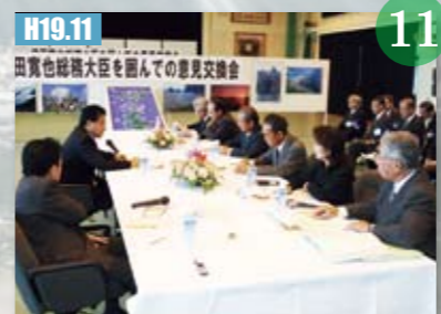
H19.11 増田寛也前総務大臣が甌島を視察