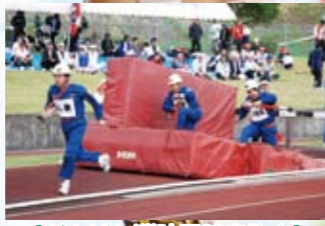
【がんばれ消防団障害物走】 筒先を抱えての障害物競走に悪戦苦闘