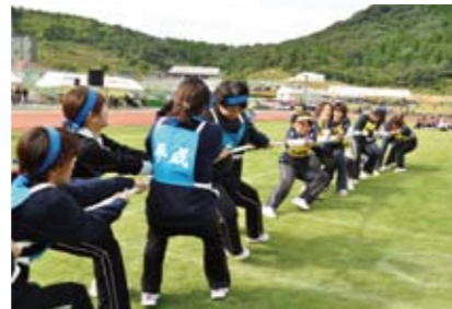
【あっちとる？ ヨイショ、勝つまで放さないぞ こっちとる？】