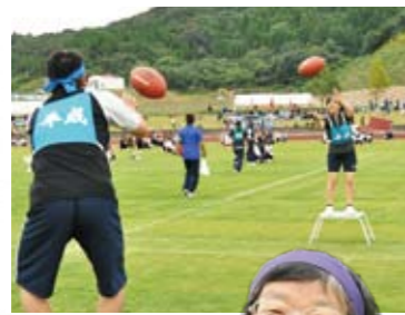
ナイスキャッチで 思わず笑顔 【ボールは踊る】