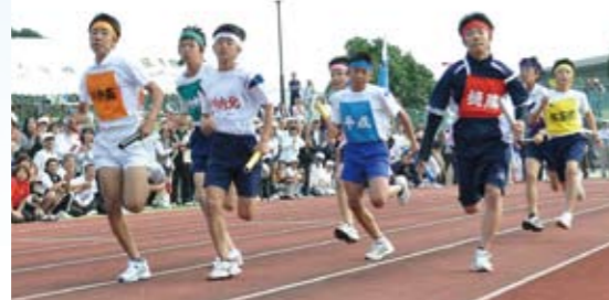
【地域対抗リレー】 地域の応援を受けて全力疾走