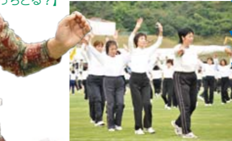
軽やかに、華やかに