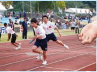
【中学生リレー】 懸命にバトンをつなぐ選手たち