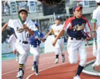
【スポーツ少年団リレー】 ダッシュ！真剣勝負です