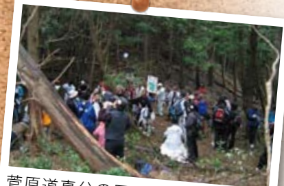
菅原道真公の歴史と足跡をたどる「プラムロード 菅原道真公探検隊」の様子。