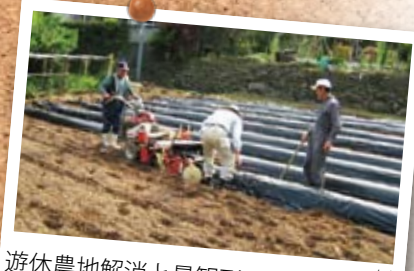
遊休農地解消と景観形成のために「甘藷(サツマイモ)」の植え付けをする地域住民ら。