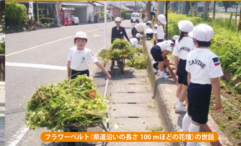
フラワーベルト(県道沿いの長さ100mほどの花壇)の世話

本市の東部、祁答院町にある上手小学校は、本年度創立131年目を迎えます。現在、45人男子23人、女子22人の児童が学んでいます。「よく勉強し、根気強く、礼儀正しく」を校訓とし、「力みなぎる上手っ子の育成」を教育目標としています。本校では、子どもの自己実現を図るため「上手5上手」(かみで5じょうず)をキャッチフレーズに、特色ある教育活動を推進しています。この「上手5上手」とは、児童会で目標を立てて取り組む「あいさつ上手」、コミュニケーション科を中心にパソコンの知識を高める「パソコン上手」、行き交う人々の目を楽しめる全長100mにも及ぶ県道沿いのフラワーベルトを世話する「花つくり上手」、20数年ほど続いている伝統の朝の駆け足「かけっこ上手」、小中一貫教育の推進や基礎