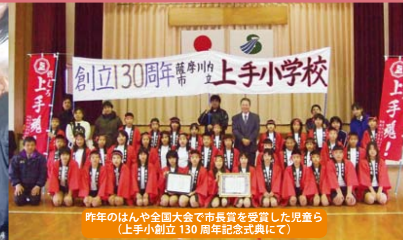
昨年のはんや全国大会で市長賞を受賞した児童ら(上手小創立130周年記念式典にて)