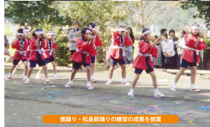
俵踊り・松島節踊りの練習の成果を披露