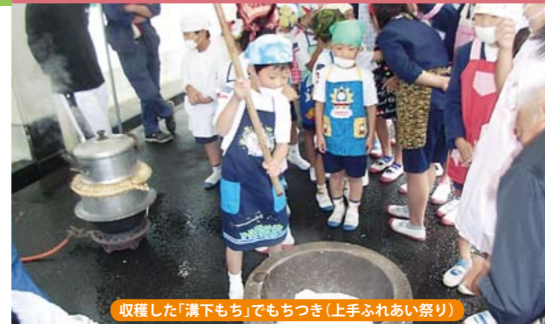
収穫した「溝下もち」でもちつき(上手ふれあい祭り)