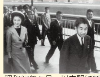
昭和37年5月 川内駅にて

天皇陛下の御在位20年をお祝いし、本市では記帳所を設置するとともに記念パネル展を開催します。