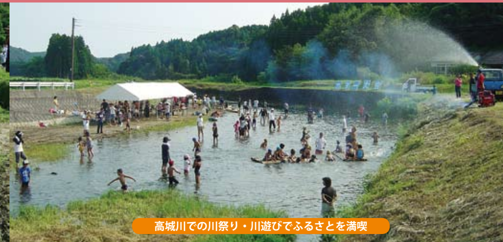
高城川での川祭り・川遊びでふるさとを満喫