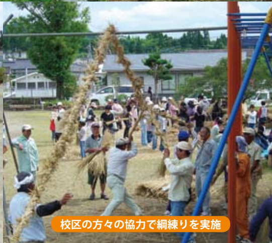
校区の方々の協力で綱練りを実施

『城上の子らを光に！』 学校生活の中で、子どもたちはさまざまな活動を行っています。子どもたち一人一人に作品応募や行事などの代表を経験させたり、得意な面を伸ばすしかけをしたりして、学習・生活・運動面で光輝かせたいと願っています。そして、先生方が子どもたち一人一人を見つめて共に活動することで、その子が自信を持ち、笑顔と喜びが生まれ、次への挑戦が期待できると考えます。『全校欠席0の日(目標百日)』子どもたちが心身共に健康で、校内に子どもたちの明るい声が響き、元氣よく遊び、学ぶ姿を願って設定しました。小規模校ならではの取り組みだと思えます。