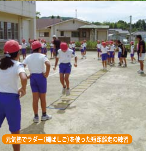
元氣塾でラダー(縄ばしご)を使った短距離走の練習