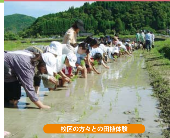
校区の方々の田植体験