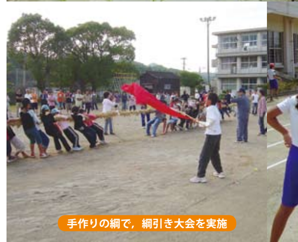
手作りの網で、綱引き大会を実施