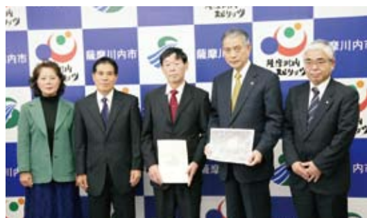
▲倉野地区コミュニティ協議会