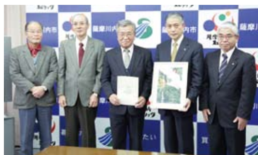
▲藤本地区コミュニティ協議会