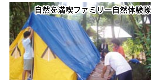
自然を満喫ファミリー自然体験隊

今年で開所23年目を迎える少年自然の家は、川内川が中央部を貫流する市街地を眼下に、標高230mの寺山に位置しています。四季折々に目を楽しませてくれる花々、愛らしい姿が美しい野鳥や山野草、昆虫類など、周囲を豊かな自然に囲まれた環境の中にあります。