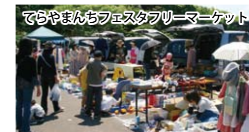
てらやまんちフェスタフリーマーケット