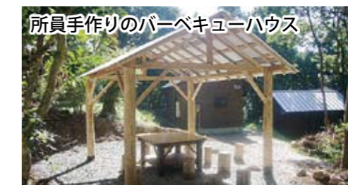
所員手作りのバーベキューハウス