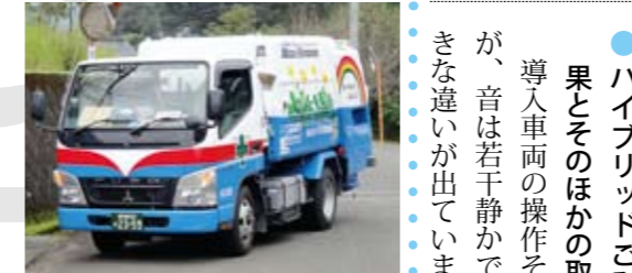
ハイブリッドごみ収集車