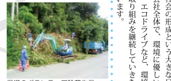
県道のボランティア除草作業

今回は、ごみ収集車にハイブリッド車を導入するなど環境に優しい取り組みを行う株式会社外菌運輸機工をご紹介します。 ※エンジンとモーターを組み合わせて走行する車 ハイブリッド車導入で 地球に優しく経費節減 ハイブリッドごみ収集車導入のきっかけは? 現在、地球温暖化防止という非常に大きなテーマの中で、トラック業界の中でも低燃費運転に力が入られている