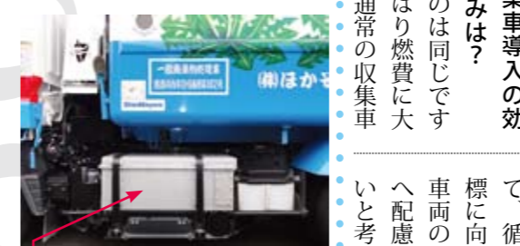
モーターでの走行時に使用するバッテリー