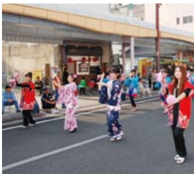
薩摩川内親善大使・元気娘もそろい踏み

11月7日(日)、旧倉野小学校校庭で、倉野地区大運動会が行われました。当日は、地区住民や倉野地区出身者、来賓など約300人が参加。幼児から高齢者まで楽しめる種目が組まれ終日賑わいました。また、昼食時には地区で用意された豚汁なども振る舞われました。