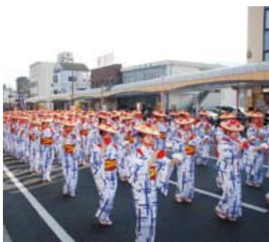
鹿児島純心女子大学の踊り連