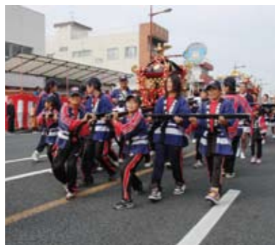
川内精舎少年消防クラブのみこしパレード