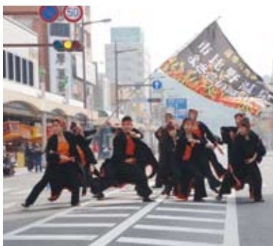
市比野温泉よさこい踊り隊の路上パフォーマンス