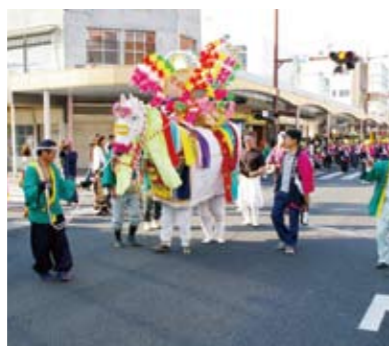
隈之城地区コミュニティ協議会からお馬さん?も参加