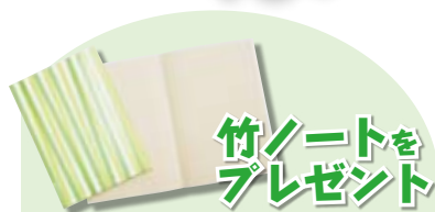
竹ノートをプレゼント 当コーナーにお便りなどが掲載された皆さんへ、竹ノート(A5判・非売品)をプレゼントします。このノートは、中越パルプ工業(株)川内工場様のご好意によるものです。お便りお待ちしております。

広報紙で見つけた公開講座で、鹿児島純心女子大学で行われた「さわやか栄養教室」に参加した時の出来事です。毎回同大学の先生方がテーマに沿って、分かりやすくお話ししてくださり、とても楽しい講座です。先日は「パソコンで簡単なアンケートに答えよう」の講座で、さあ大変。「来年80歳です。」とおっしゃる方やパソコンに触れるのも初めての方々がたくさん。急ぎょパソコン教室の始まり。先生も上着を抜いで、学生さん方の応援も駆け付けました。先生の「クリックするの勉強の一つですよ。」に励まされ、皆さん講座の終わるころには少しは上達しましたよ。楽しい講座を毎回ありがとうございます。