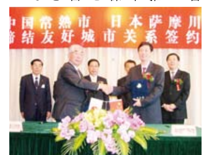
常熟市での再調印式(平成17年)

平成3年7月に常熟市と旧川内市の間で友好都市締結が行われ、いよいよ今年で20周年を迎えます。これは、経済・文化・教育・体育など各分野において交流を推進し、両市の友好関係を発展させることを目的に締結されたものです。