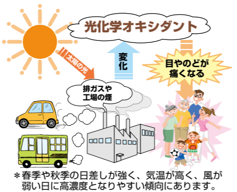
*春季や秋季の日差しが強く、気温が高く、風が弱い日に高濃度となりやすい傾向にあります。

通常市内では、環境基準の0.06ppm以下であり、問題はありませんが、大気中の濃度が0.12ppm以上となり、気象条件から汚染状態が継続するときに「光化学オキシダント注意報」が発令されます。本市でも、平成21年5月8日に注意報が発令されました。今からの時期は濃度が高くなり、注意報が発令される可能性が高くなります。