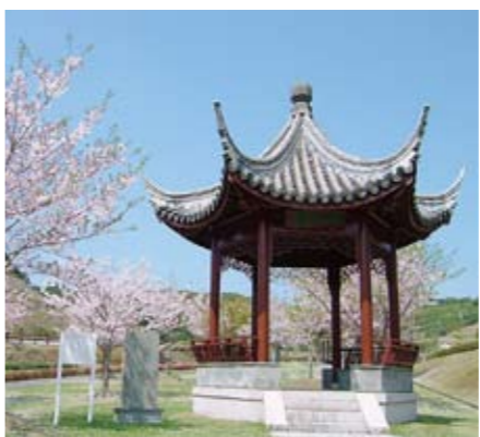
▲建築団6人の派遣により平成13年6月に建設・寄贈された「琴川亭」

常熟市は山がきれいで、湖が鏡のように連なっており、その形が古琴に似ていることから「琴川」との異名でも知られています。 80年代から、両市の友好交流は盛んになってきました。友好都市締結3周年の際、旧川内市民からの募金で紅葉の木を数千本、常熟市の尚湖に植栽し「川内の森」と名付けられました。7年後、今度は常熟市民が伝統の六角亭を1棟、本市の総合運動公園に建て、「琴川」と「川内」から文字をとり、「琴川亭」と命名しました。これは、両市の永遠の友情と平和の象徴となっています。(琴川亭記より)