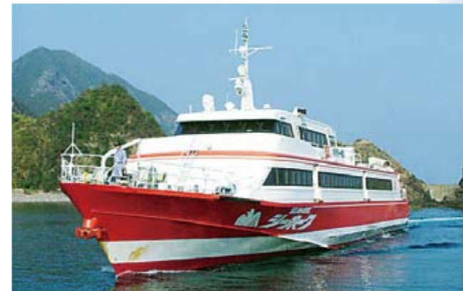
現在就航中の高速船「シーホーク」

甕島航路は、本土と甕島を結ぶ唯一の交通手段ですが、近年の利用者減少と燃料油価格の高騰で、運航事業者である甕島商船(株)の経営状況は年々厳しくなっています。また高速船「シーホーク」は老朽化が著しく、早急に代替船の建造が必要な状況です。このことから、市が甕島商船(株)に代わって新高速船を建造し、無償で貸し付ける「公設民営方式」により、平成26年春、川内港から甕島(里港・長浜港)へ就航させることになりました。