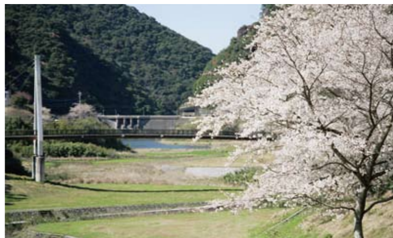
10 清浦ダム(浦之名) 周辺には500本の桜が植えられ、春はお花見の場として多くの観光客が訪れる。