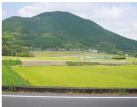
20 蘭牟田の農地(蘭牟田) 緑の山々に囲まれた田園風景は、のどかな癒やしの成分たっぷり。