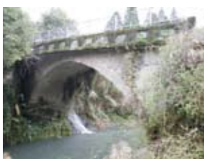
18 岩元橋(南瀬) 橋長16.2m・幅員4m。大塚バス停(国道267号)を北へ左折し1km先。(架設年代不明)