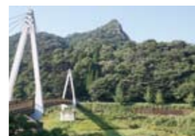
9 鷹ノ子岳とゆめかけ橋(浦之名) 鷹ノ子岳のたもとへ架かるゆめかけ橋。歩いて登ることができる。標高422.1m。