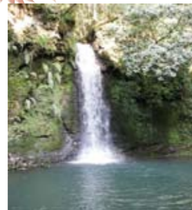
14 轟滝(浦之名) 地元の方々が市道からの遊歩道を整備。広い滝つぼが特徴的。