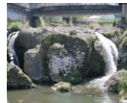
3 湯の滝(市比野) 市比野温泉の中心部にある滝。入浴後の散策が心地よい。駐車場あり。