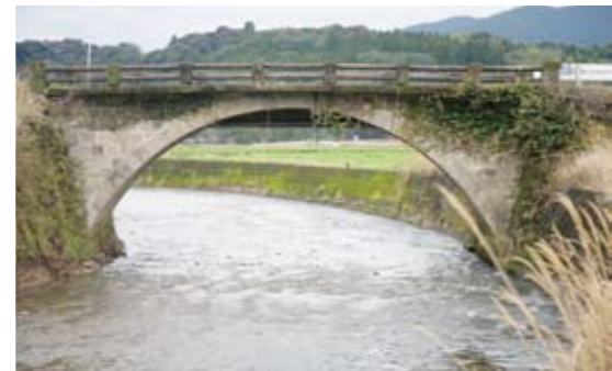
21 成木田橋(上手) 明治36年に架設された石橋。橋長14.8m・幅員3.51m。祁答院支所から1.6km。