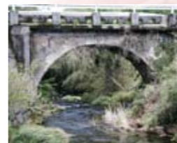
1 幸橋(市比野) 明治33年に架設された石橋。橋長10m・幅員3.2m。藤本小学校近く。