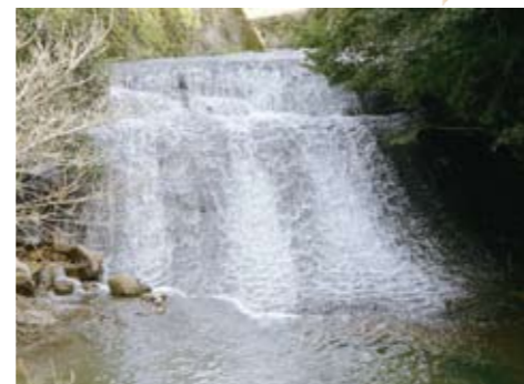
19 鈴連滝(黒木) その名の通り、優しく流れ落ちる姿が印象的な滝。