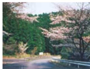
16 林道山田本俣線(山田) さつま町・阿久根市などに繋がる林道。春に道沿いを彩る桜は必見。