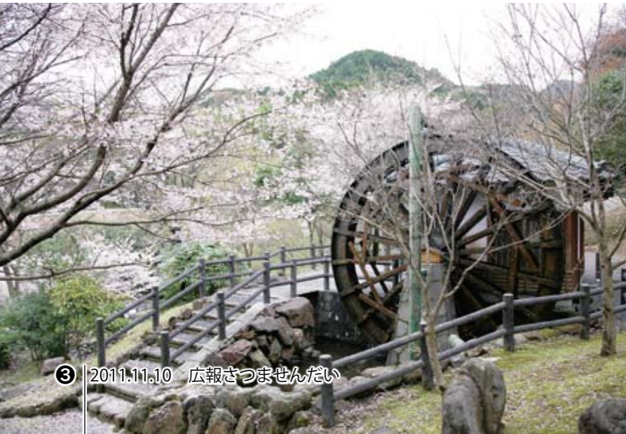
22 矢立農村公園(黒木) 農村風景を楽しみながら、いろいろな自然遊びの体験もできる。