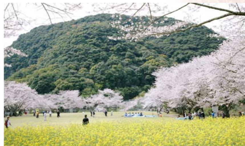
4 丸山自然公園(市比野) おわんを伏せたような丸い形の丸山は地域のシンボル。