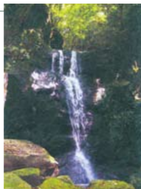
12 洗心の滝(浦之名) 一枚岩に力が加わって、斜めに傾いたような岩肌の筋が印象的。