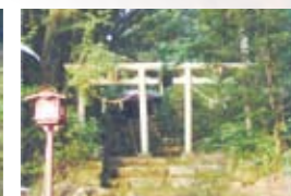
5 諏訪神社(伊スノキ)(浦之名) 境内にある伊スノキは推定樹齢600年以上。周囲は3mある。市指定天然記念物。