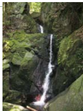
13 仙人の滝(浦之名) 落差約10mの滝。上部にもう一段の流れがある。