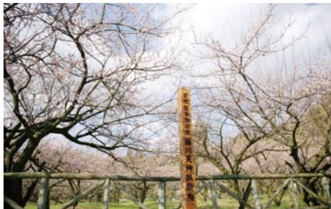
17 藤川天神(藤川) 菅原道真公を祀る神社。毎年2月中旬～3月上旬には約150本の梅の花が咲き誇る。