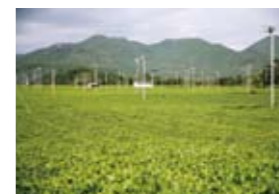
8 茶畑と愛宕山(浦之名) 一面に広がる茶畑と、その奥に望む愛宕山とが織り成す景観は必見。