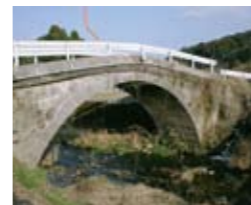
2 大塚橋(市比野) 明治39年に架設された石橋。橋長11.7m・幅員3m。盛り上がった中央部が特徴。