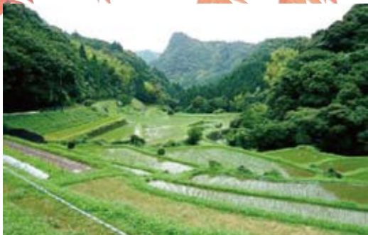
15 内之尾の棚田(浦之名) 150枚の田が等高線沿いに並ぶ。農林水産省指定「日本棚田百選」に選定。