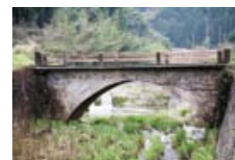
6 松尾橋(浦之名) 大正11年に架設された石橋。橋長10.2m・幅員3.46m。大馬越小学校から南に約550m。