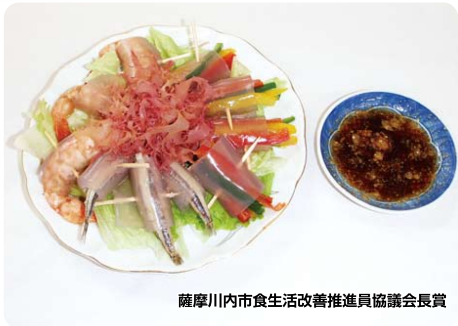
薩摩川内市食生活改善推進員協議会長賞