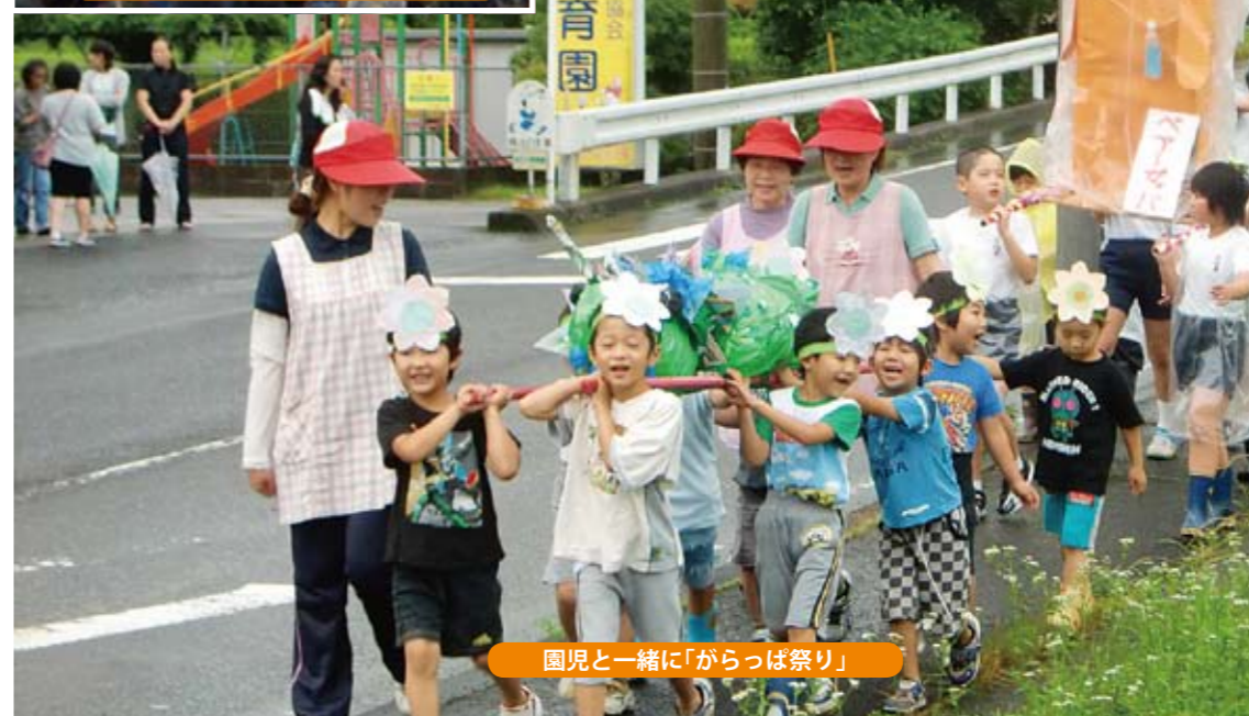
園児と一緒に「からっば祭り」