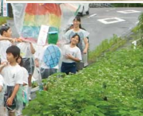
園児との「ふれあい活動」