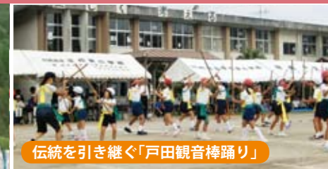
伝統を引き継ぐ「戸田観音棒踊り」