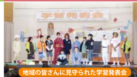
地域の皆さんに見守られた学習発表会

中央図書館では、電気設備改修工事のため次の期間休館します。市民の皆さまには大変ご迷惑をお掛けしますが、ご理解とご協力をお願いいたします。 【期間】 11月26日(木)～2月1日(水) 【問合せ先】 中央図書館 中央図書館臨時休館のお知らせ 中央図書館では、電気設備改修工事のため次の期間休館します。市民の皆さまには大変ご迷惑をお掛けしますが、ご理解とご協力をお願いいたします。