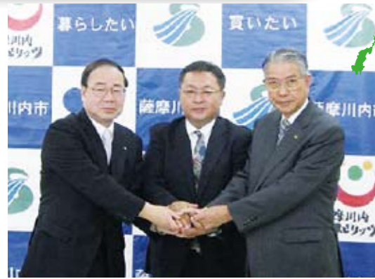
▲(株)リンク 瀬戸口代表取締役(写真中央)