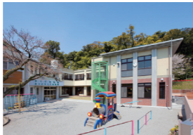
▲みくにキッズ保育園