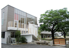
▲川内隣保館保育園