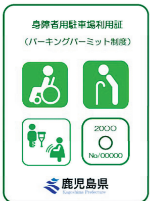
▲身障者用駐車場利用証

身障者用駐車場を適正にご利用いただくため、障害のある方など歩行が困難と認められる方に対して、「身障者用駐車場利用証」が交付されます。