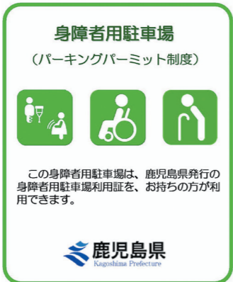
▲身障者用駐車場表示板(協力施設案内表示)

まで交付を行っています。申請方法、交付対象者などにつきましては、県ホームページ( http://www.pref.kagoshima.jp/ )をご覧ください。お問い合わせください。 *利用証をお持ちでない方は、この制度をご理解の上、身障者用駐車場表示板のある駐車場に駐車しないなど、ご協力をお願いします。