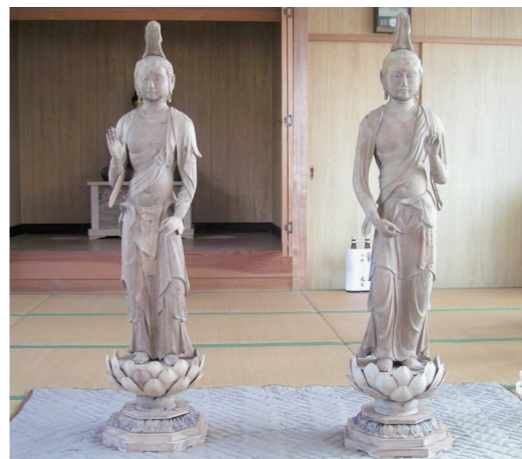
安置前の両脇侍像