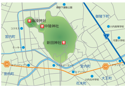
中陵・端陵の位置図

新田神社周辺の山陵 この新田神社周辺(宮内町)は「神亀山」と呼ばれており、可愛山陵・中陵・端陵という3つの古墳が集まっています。 中でも可愛山陵は高さ70mと最も大きく、新田神社で祭られている瓊瓊杵尊の子孫の御陵とされています。