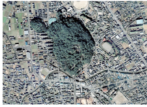
上空からの神亀山