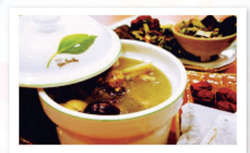
同センターの薬膳