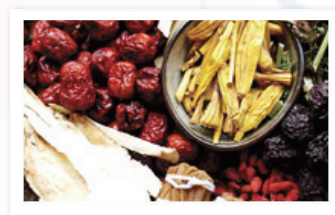
同センターの漢方薬