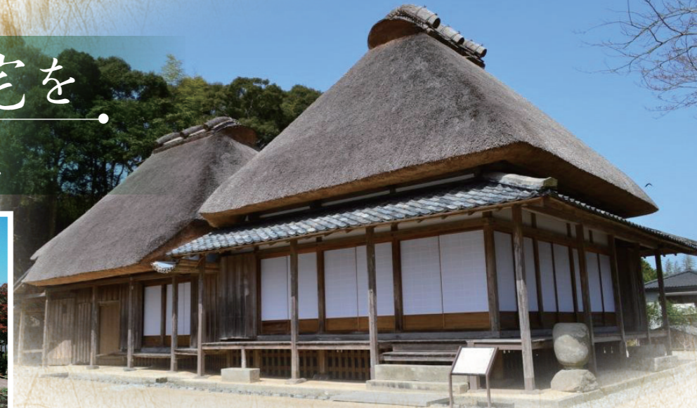
保存修理工事後の旧増田家

入来町に入来麓武家屋敷群の公開施設として、旧増田家住宅が4月1日にオープンしました。 旧増田家住宅は、母屋、石蔵、浴室便所、洗い場が一体となって保存されています。敷地入口には、明治6年の石敢当があり、母屋はその頃までに建築されたと考えられています。また、石蔵には、大正7年4月竣工の刻銘がありました。 今回の保存修理工事では、母屋の屋根が当初はかやぶきであった痕跡を確認できたことから、修理前の瓦ぶきからかやぶきに復元しました。 旧増田家住宅を見学される方は、市役所入来支所下の駐車場をご利用いただき、入来麓武家屋敷群や清色城跡など周囲の散策も一緒にお楽しみください。 ※魔よけの石碑や石像