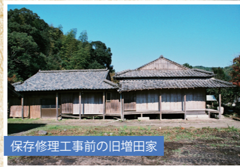
保存修理工事前の旧増田家