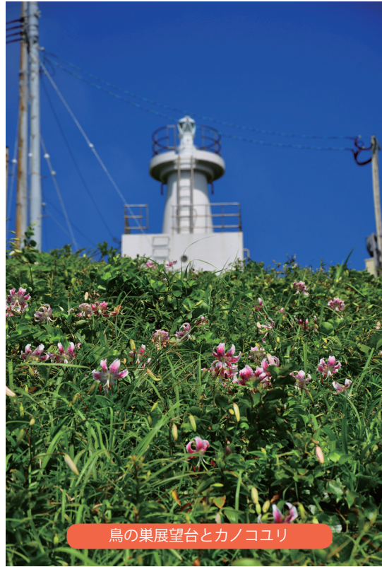
鳥の巣展望台とカノコユリ