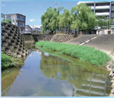
▲春田川親水公園の様子 下水道につないできれいな川にしましょう。

下水道とは 生活排水を地下に埋められた下水道管に集め、下水処理場(浄化センター)で処理し、きれいな水にして自然に返すのが下水道です。 今までは、生活雑排水をそのまま側溝へ放流していたため、側溝にたまって悪臭や害虫の発生原因となったり、そのまま川へ流れこんで川を汚す原因となったりしていました。これは、生活様式の変化や市街化の発展に伴って人間の排出した汚水量が増加し、自然の力だけでは浄化できなくなってきたからです。