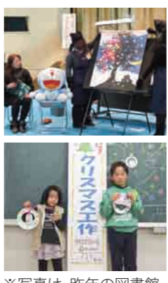
※写真は、昨年の図書館フェスタの様子です。

幼児から大人まで幅広い市民の皆さんに、図書館活動の一端に触れ、図書館に親しんでいただくため、「薩摩せんだい図書館フェスタ」を開催します。市内各地域で活動されている読書グループの皆さんによる実演・活動発表やクリスマス工作など、図書館や本の魅力が満載の催しです。お誘い合わせのうえ、お気軽にお越しください。