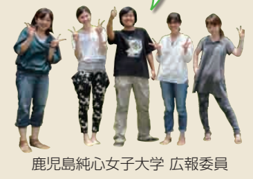
鹿児島純心女子大学 広報委員